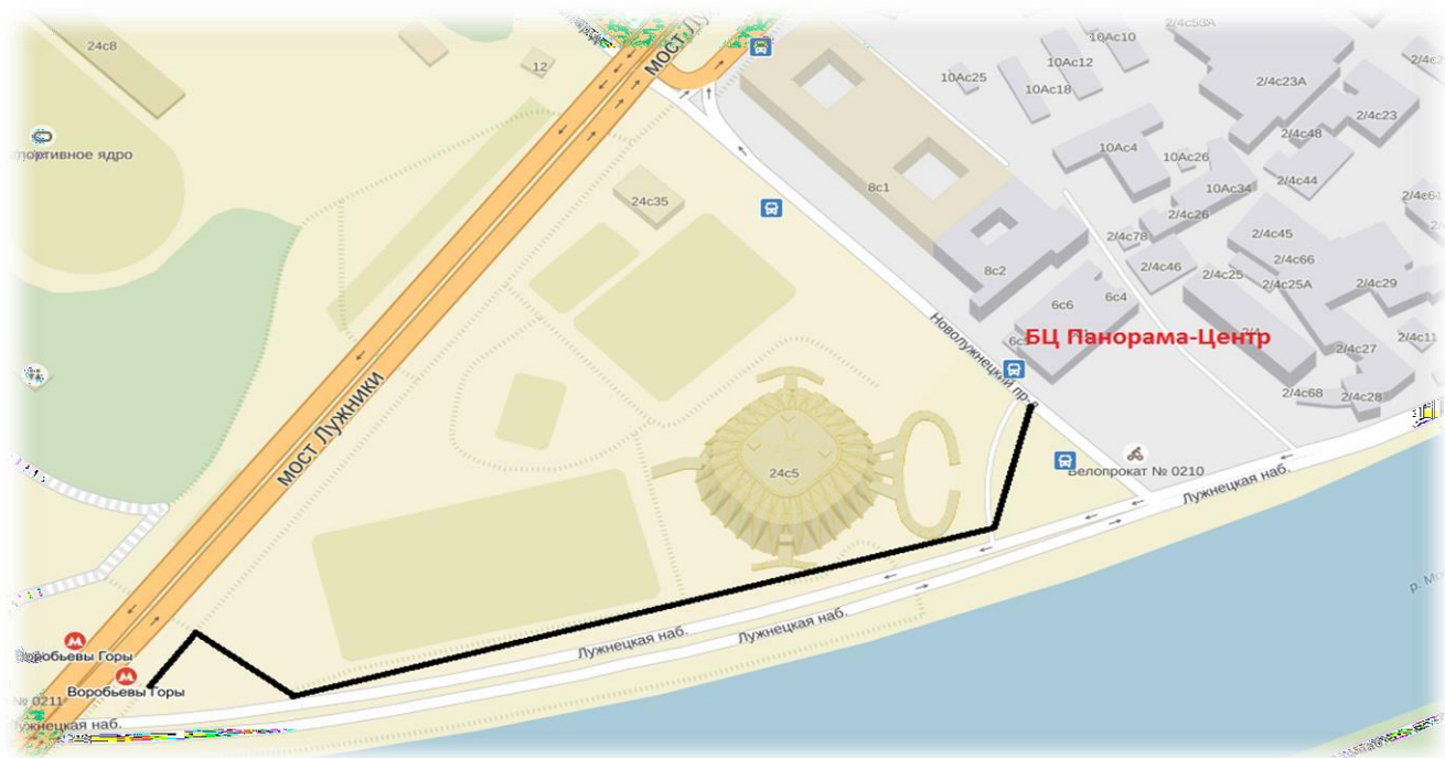
Схема прохода к Бизнес-Центру «Панорама-Центр»