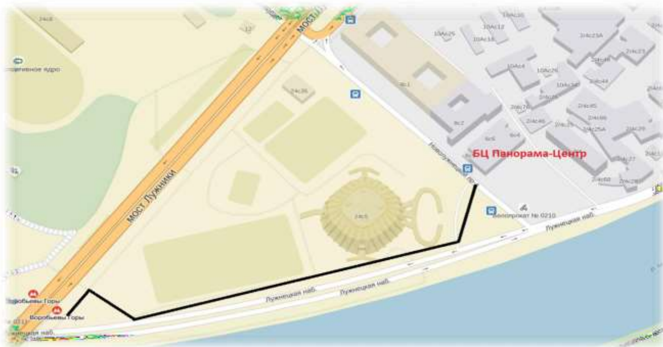
Схема прохода к Бизнес-Центру «Панорама-Центр»