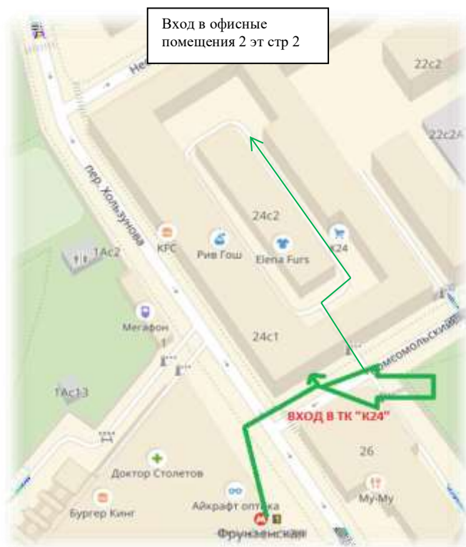
Схема прохода к ТЦ «К-24»