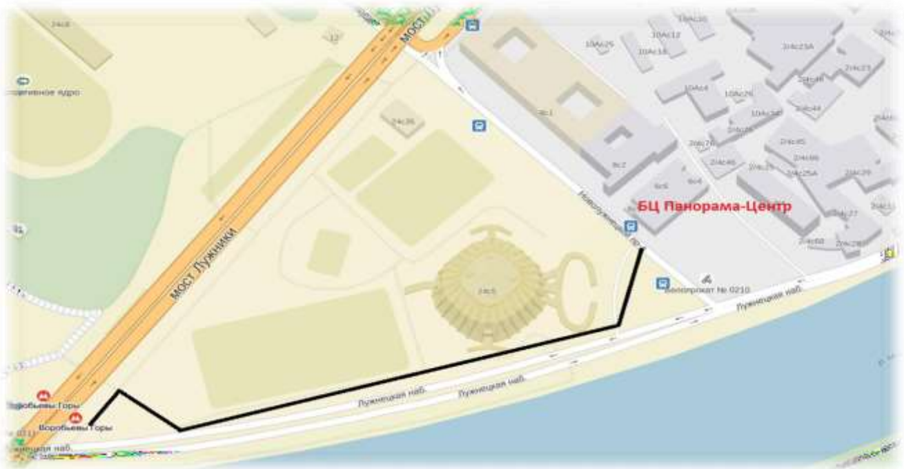
Схема прохода к Бизнес-Центру «Панорама-Центр»